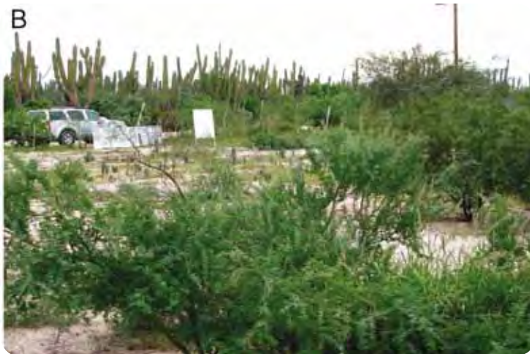
Fotografía: Restauración en El Comitán. A) Suelo dañado antes de la reforestación. B) Suelo mejorado a los ocho años después de la reforestación, autor: De Bashan et al.