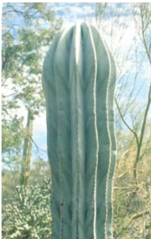
קרדון הגדל בתוך סלע גרניט ללא אדמה