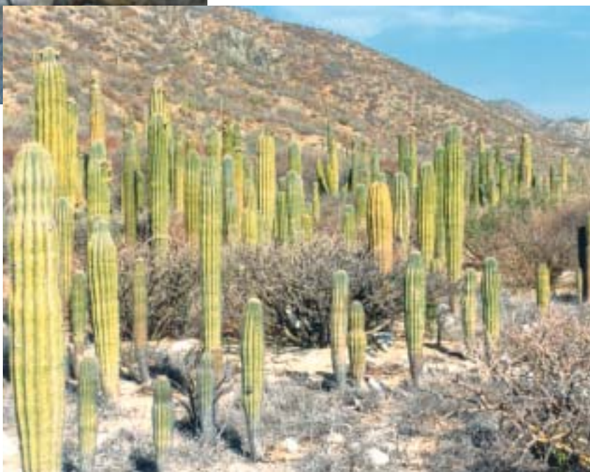
יער קרדון צעיר